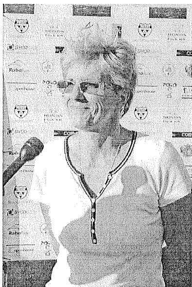
Dornbach Ildikó Magyar Atlétikai Szövetség szövetségi kapitány

Az elmúlt évek sikereinek köszönhetően az idei gála megrendezésében is segítséget vállalt Győr Megyei Jogú Város, hogy a Megyei Atlétikai Szövetséggel és a Győri Atlétikáért Alapítvánnyal karöltve ismét színvonalassá tegye az eseményt.