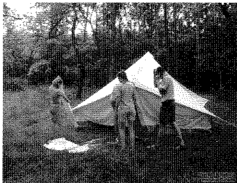
Épül az új sátor