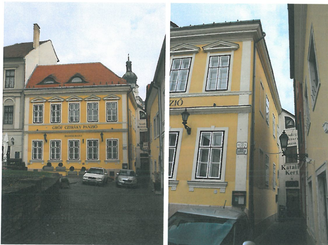
Czuczor Gergely utca 3.