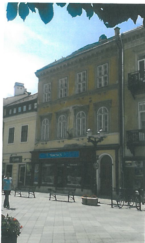
Arany János u. 11.