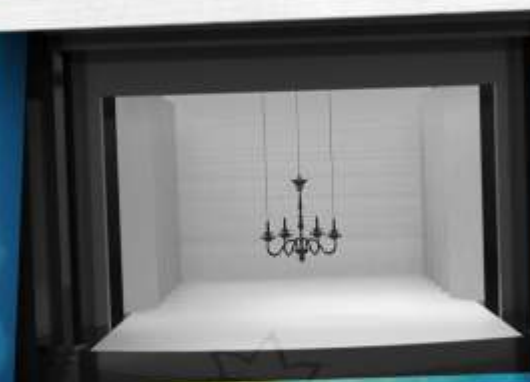
MICHAC GÁBOR JELMEZ- ÉS DÍSZLETTERVEI