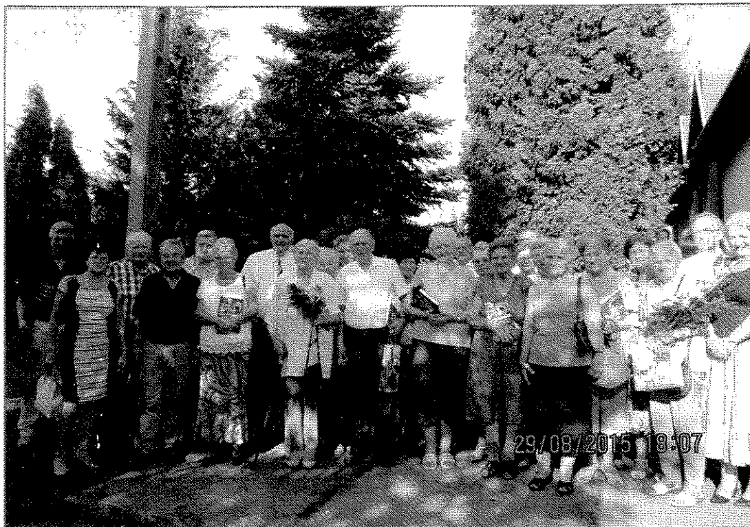
Könyvbemutató Puztacsalád (2015. augusztus 29.)