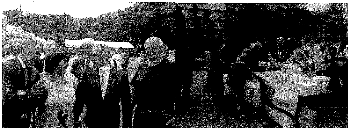
Országos Polgárőr Nap 2015.06.20.