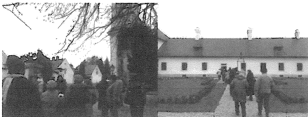
A kamalduli remetesség